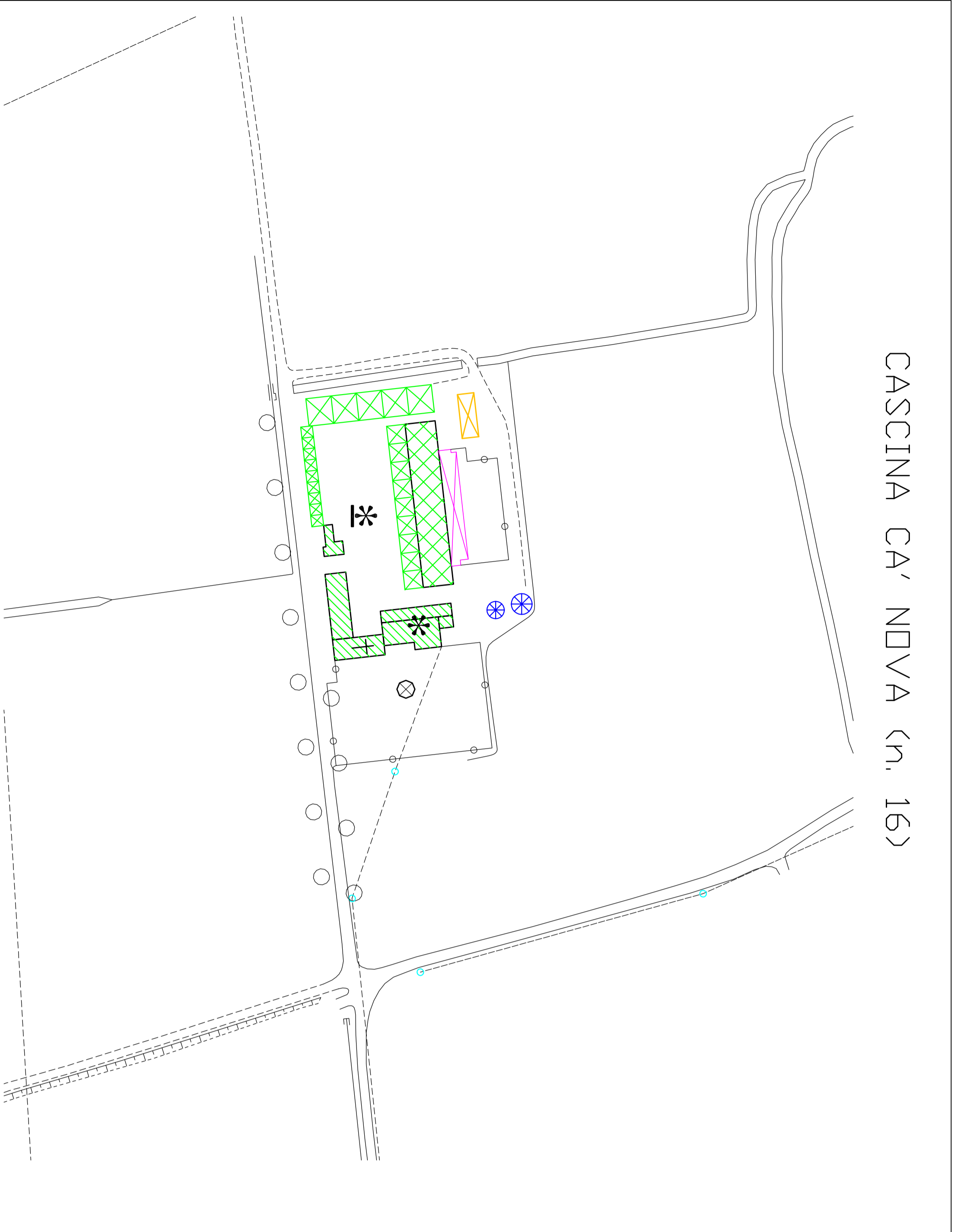
CASCINA CA' NOVA (n. 16)