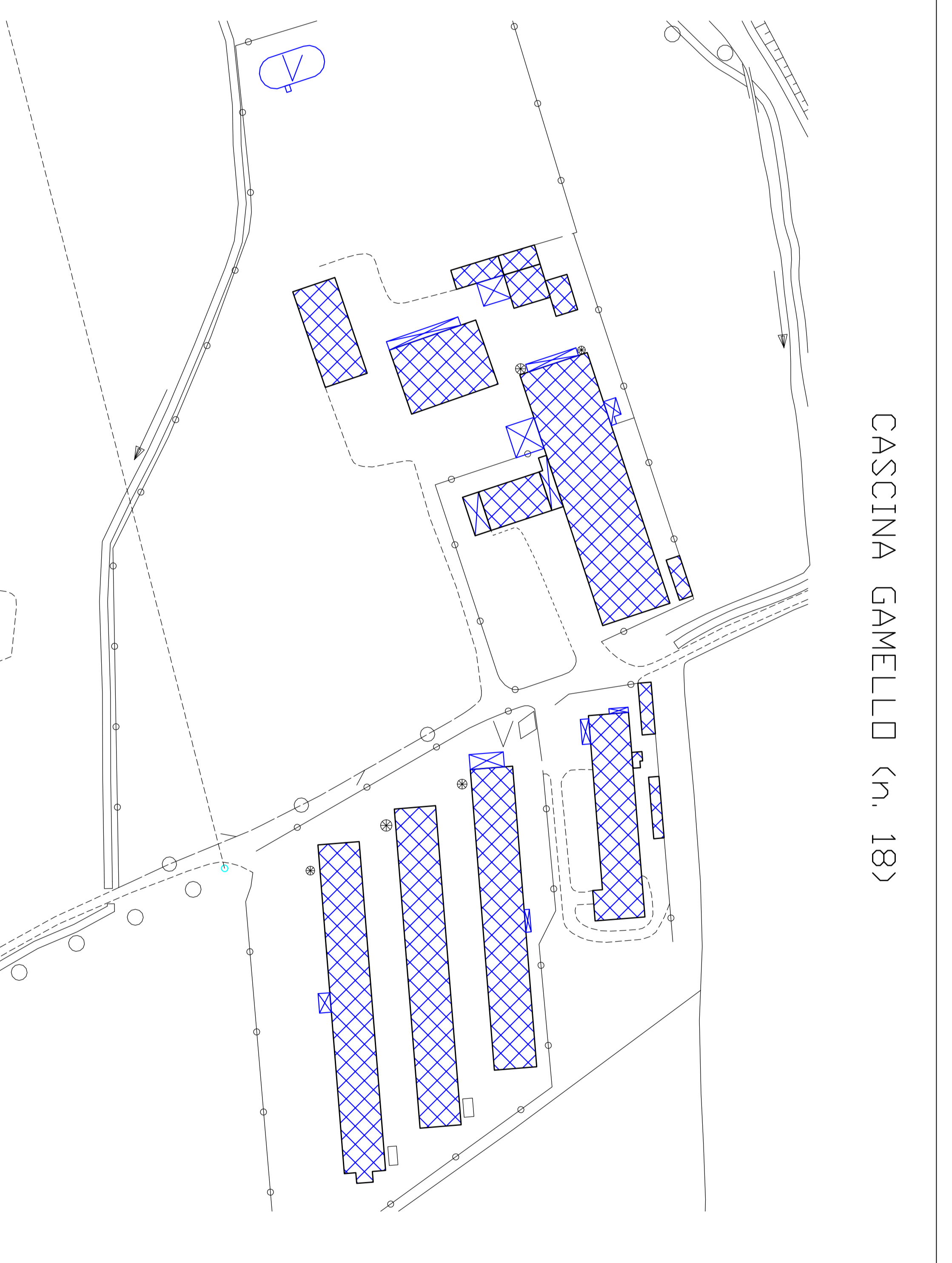
CASCINA GAMELLO (n. 18)